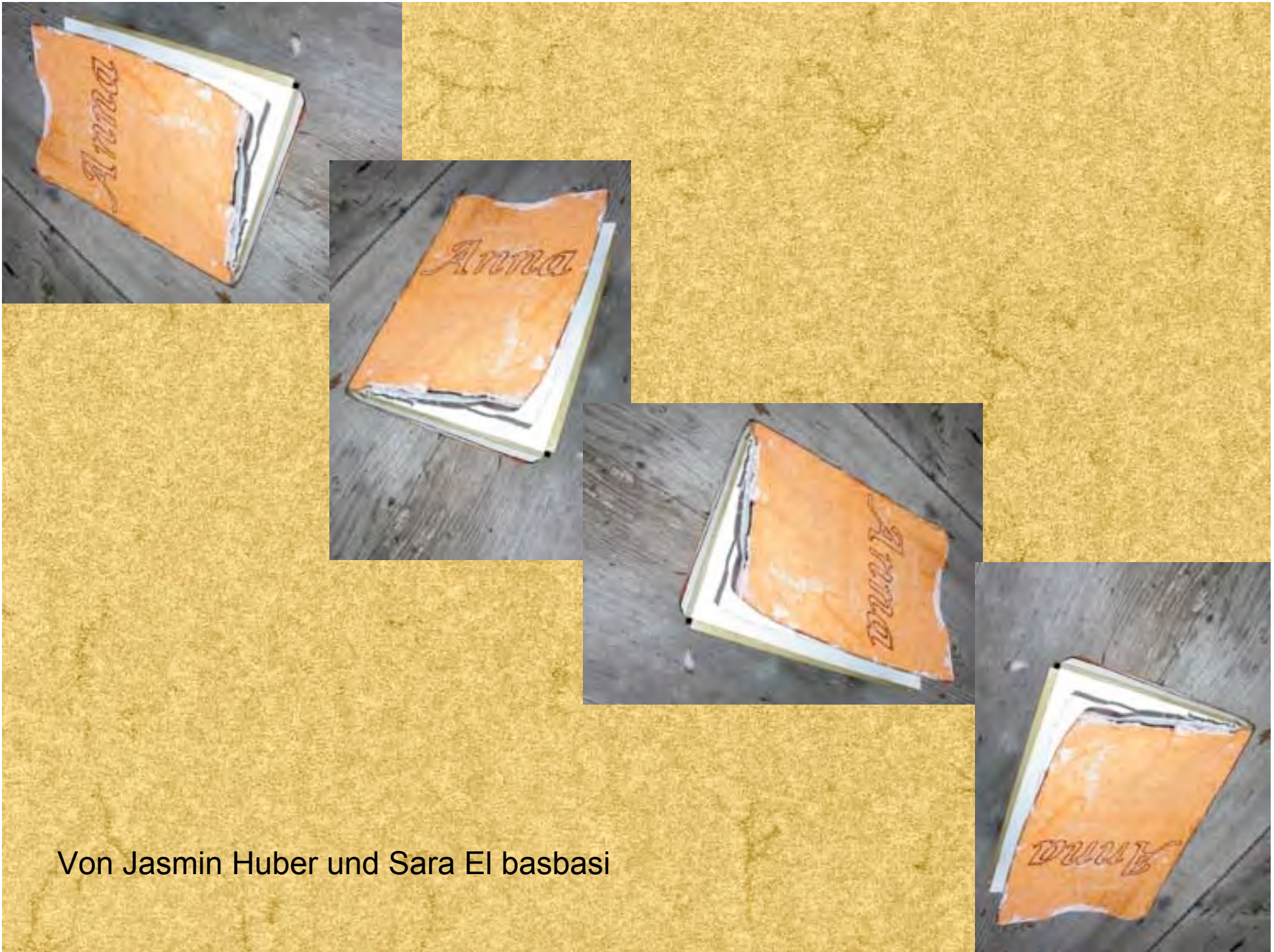
Von Jasmin Huber und Sara El basbasi